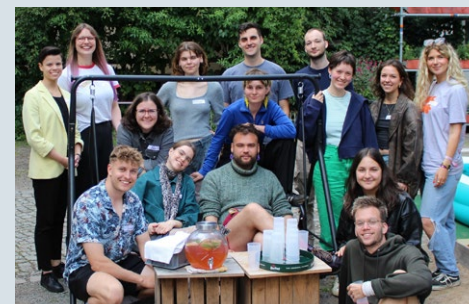
Das Moderationsteam beim Abschlussmodul der Moderationsausbildung