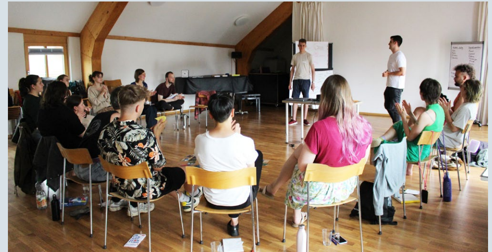
Durchführung der "Moderationsausbildung für konstruktive junge Dialogformate"