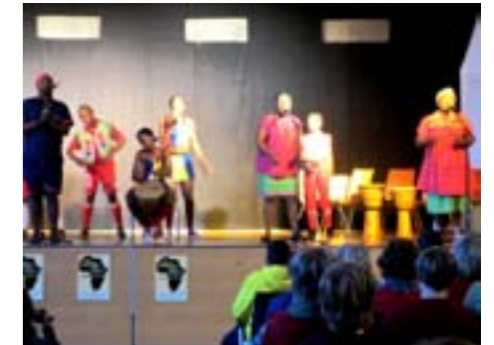
Der Golden Youth Club zu Gast in Pirna