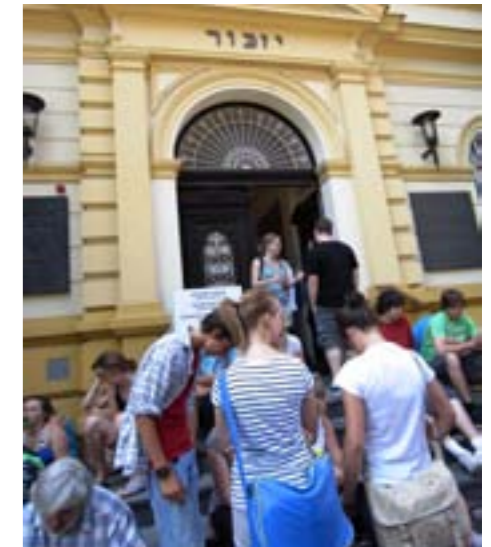
Deutsche und tschechische Schüler werden gemeinsam die Gedenkstätte Theresienstadt besuchen, wie hier Schülerinnen und Schüler aus Dippoldiswalde

Um kontinuierliche Kontakte zwischen deutschen und tschechischen Jugendlichen pflegen zu können und Vorurteile gegen authentische Erfahrungen zu ersetzen, bedarf es langfristiger Kooperation zwischen der Aktion Zivilcourage und den tschechischen Partnern. Langfristigkeit kann jedoch nur mit Hilfe von professionell konzipierten Maßnahmen gewährleistet werden.