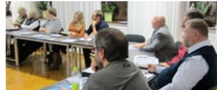
Teilnehmer aus verschiedenen Vereinen während des Workshops

Diese und ähnliche Fragen beantwortete der Redakteur der Sächsischen Zeitung (SZ) Alexander Müller in einer Runde von ehrenamtlich Engagierten im Rahmen der Weiterbildungsreihe „Projekt? Perfekt!“. Herr Müller beschrieb uns den Ablauf in der Pirnaer Lokalredaktion und den Aufbau des Lokalteils der SZ. Dabei wurde den Anwesenden aus Pirna deutlich, dass für Informationen aus der Kreisstadt lediglich eine Seite zur Verfügung steht und dieser Platz häufig noch durch Anzeigen eingeschränkt wird. An der neuen Rubrik „Pirnaer Stadtleben“ konnten wir das neue Konzept der Zeitung verstehen. Im Mittelpunkt stehen immer Menschen aus dem Landkreis und ihre Erlebnisse und Geschichten. Nüchterne, faktenreiche Berichterstattung ist nicht mehr gefragt. Daher ließ es sich auch erklären, dass Pressemitteilungen mit rein sachlichen Schilderungen von Sportereignissen oder Veranstaltungen von Vereinen nicht ins Konzept passen. Würde man den Bericht aus persönlicher Sicht eines Teilnehmers oder Organisators schildern, dann wäre es für die