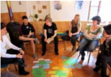
Während der Diskussionsrunde zum Thema „Gedenkstättenpädagogik“; Gemeinsames Wandern (oben)

Danach wanderten wir auf den nahe gelegenen Hohen Schneeberg. Unterwegs kam es zu regen Diskussionen und Gesprächen. Nach einer ausgiebigen Rundwanderung um den Schneeberg, mit diversen Pfützen und Schlammflöchern, kamen wir bei Einbruch der Dunkelheit wieder am Gästehaus an. Ein Lagerfeuer wurde entfacht, an dem wir uns erholen und den Abend in Ruhe ausklingen lassen konnten.