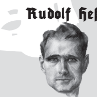
Märtyrer für Deutschland

Er war seit 1920 Mitglied der NSDAP und der Stellvertreter von Adolf Hitler. Rudolf Heß flog 1941 nach England, möglicherweise um eigenmächtig über einen Waffenstillstand zu verhandeln. Er wurde bis Kriegsende inhaftiert und von Hitler zum »Psychopathen« erklärt. Im Nürnberger Prozess wurde er zu lebenslanger Haft verurteilt und beging 1987 Suizid. In der rechtsextremen Szene geht man jedoch bis heute fälschlich davon aus, dass Heß ermordet wurde und glorifiziert ihn daher als »Märtyrer für Deutschland«.