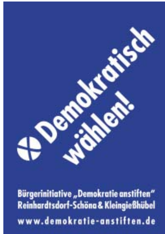
Im Kommunalwahlkampf ermutigt die Bürgerinitiative mit Plakaten zur demokratischen Stimmabgabe.

„Demokratie anstiften“, so heißt der treffende Name der seit 2004 aktiven Bürgerinitiative von rund 20 Mitgliedern aus Reinhardtsdorf, Schöna und Kleingießhübel. Oberstes Ziel ist für die Initiative, Demokratie erfahr- und erlebbar zu machen. Die Gruppe möchte so auf den Schutz von Grund- und Menschenrechten aufmerksam machen sowie Rechtsextremismus als Gefahr für diese entlarven. Die ehrenamtlich arbeitende Bürgerinitiative versucht, den Menschen in der Gemeinde ihre Ideen von einem toleranten und mitmenschlichen Miteinander durch verschiedenste Veranstaltungen näher zu bringen. Dazu gehören Vorträge und Lesungen zu ganz unterschiedlichen Themen: u. a. Rechtsextremismus, Tourismus oder Judentum. Genauso aber Kulturelles wie Theateraufführungen oder die Unterstützung eines