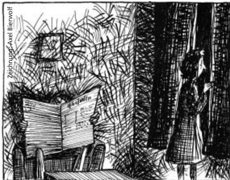
„Du, die werfen da unten bei den Geschäften die Schaufenster ein ...“

Dieses Ereignis zeigt die Verführbarkeit von Menschen, wenn man sie nur lange genug (in diesem Fall antisemitisch) indoktriniert. Es entsteht dann ein geistiges Klima, in welchem es nur noch eines propagandistischen Funksens (hier das Attentat von Paris) bedurfte, um die Synagogen in Flammen aufgehen zu lassen, zu Mördern zu werden. Es zeigt aber auch, dass gegenüber massiver und brutaler staatlicher Gewalt Zivilcourage nur ein schwaches Pflänzlein ist. Wir müssen Verhältnisse schaffen, in denen Zivilcourage erst gar nicht gebraucht wird. Solche Verhältnisse werden wir haben, wenn wir jeder politischen Meinung entgegentreten, welche die Würde des Menschen, seine Integrität, seine Einmaligkeit und seine Individualität in Frage stellt.