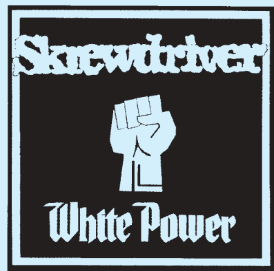
Skrewdriver war eine der frühesten rechtsextremen Szenebands.

Die CDs haben Titel wie „Gaszimmer“, „Aus dem Führerhauptquartier“, „Kingdom of Hate“ oder schlicht „Für Deutschland“. Solche und ähnliche Machwerke rechts-extremer Bands, die sich „Terror-korps“, „Endlöser“ oder „Hass-kommando“ nennen, hat die Bundesprüfstelle für jugendgefährdende Medien im vergangenen Jahr auf den Index gesetzt. Insgesamt waren es 99 CDs, eine Langspielplatte sowie vier Bücher und drei Schriften, die bei Androhung von Geld- oder Freiheitsstrafe Kindern und Jugendlichen nicht mehr zugänglich gemacht werden dürfen – wegen rassistischer Inhalte, wegen Verherrlichung oder Verharmlosung des Nationalsozialismus oder des Krieges. Filme und DVDs waren 2006 im Unterschied zu früheren Jahren nicht dabei.