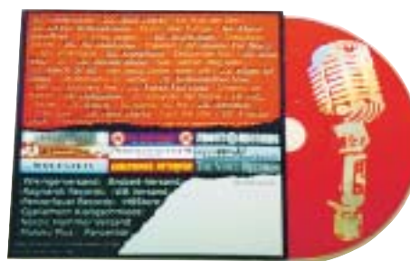
Mit ihrem so genannten „Projekt Schulhof“ versucht die NPD, mit Musik unpolitische Jugendliche zu werben.

Mit kostenloser Nachhilfe will die rechtsextremistische NPD in Sachen offenbar Kinder für ihre Ideen gewinnen. Schwerpunkt dieser Aktivitäten sind nach Erkenntnissen des sächsischen Lehrerverbandes Pirna und Königstein. Die NPD versuche, über diese Form der Unterstützung ihr Gedankengut an die Schüler heranzutragen. Zielgruppe seien bereits Zehnjährige, die dann mit 13 oder 14 Jahren als