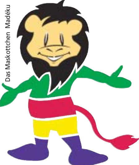
Das Maskottchen Madéku

AUSZUG AUS DER REDE VON OBERBÜRGERMEISTER MARKUS ULBIG AUF DEM LETZTJÄHRIGEN „MARKT DER KULTUREN“.