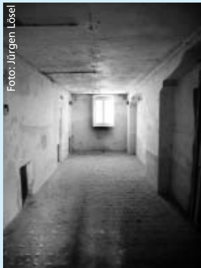
Die ehemalige Gaskammer in der Tötungsanstalt Pirna-Sonnenstein.

Die Mütter und Väter des Grundgesetzes haben sich den wissenschaftlich unbegründeten und absurden Rassenwahn der Nationalsozialisten eine Lehre sein lassen. Das teuflische an der Lehre von der Unterlegenheit einer Rasse ist, dass der angeblich Angehörige einer solchen Rasse durch Geburt und lebenslang mit diesem Makel behaftet sein soll. Seine persönlichen Fähigkeiten und Leistungen zählen dabei nichts. Das Grundgesetz verbietet eine solche pauschale Benachteiligung „von Geburts wegen“. Es geht vielmehr davon aus, dass jeder nach seinen Fähigkeiten und seinem Willen sein Leben gestalten kann. Alle sollen die gleichen Möglichkeiten haben, ihre Fähigkeiten zu entwickeln und ihre Wünsche zu verwirklichen. Natürlich gelingt das nicht allen in gleichem Maße.