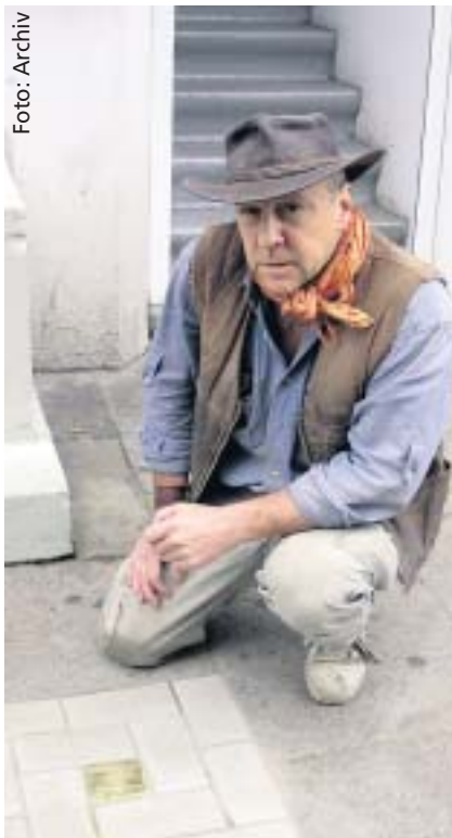
Gunter Demnig verlegt seit 1995 die Stolpersteine – bislang sind es 9 000 in 190 Orten.