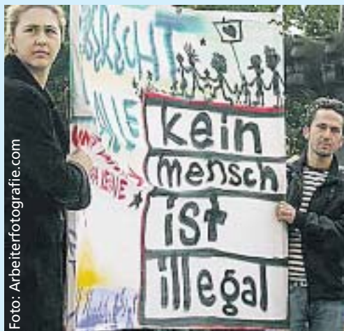
Recht so. Kein Mensch darf ausgegrenzt werden.

In Deutschland haben politisch Verfolgte Anspruch auf Anerkennung als Asylberechtigte (Grundgesetz Art. 16). Als politisch verfolgt gilt, wer wegen seiner Rasse, Religion, Nationalität, Zugehörigkeit zu einer sozialen Gruppe oder wegen seiner politischen Überzeugung Verfolgungsmaßnahmen mit Gefahr für Leib, Leben oder Beschränkungen seiner persönlichen Freiheit ausgesetzt ist oder solche Verfolgungsmaßnahmen begründet befürchtet. 1993 ist diese Regelung eingeschränkt worden. Seitdem haben Personen, die aus so genannten