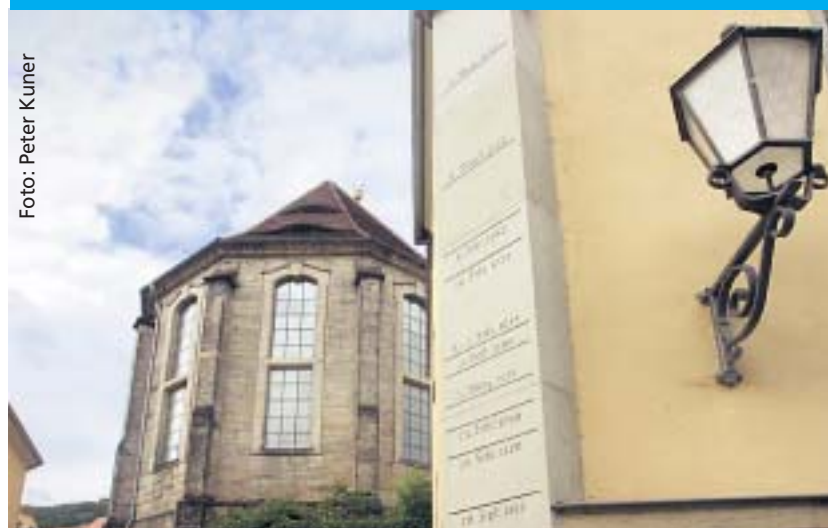
Von der Kirche und dem Rathaus ging die Initiative für die Sammelaktion aus.