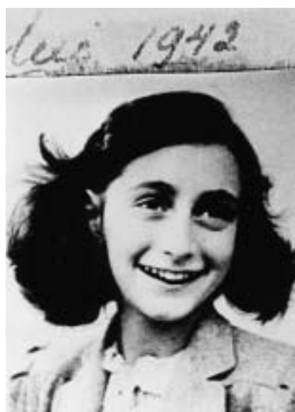
Anne Frank wurde nur 15 Jahre alt.

hielt sich die Familie mit anderen in einem Hinterhaus verborgen, wo sie bis zum Verrat ihres Versteckes 25 Monate unentdeckt blieben. Dort schrieb Anne Frank ihr weltberühmtes Tagebuch, das in 67 Sprachen übersetzt worden ist. Es gibt verschiedene Versionen des Tagebuches. Die erste und ursprüngliche entstand aufgrund einer Radioübertragung aus London, in der ein Mitglied der holländischen Regierung sagte, dass alle Tagebücher und Briefe, die vom Leben im Krieg berichteten, gesammelt und später einmal veröffentlicht werden sollten. Da Anne Journalistin und Schriftstellerin werden wollte, verfasste sie noch eine zweite Version des Tagebuches. Diese überarbeitete Version sollte ihr später einmal