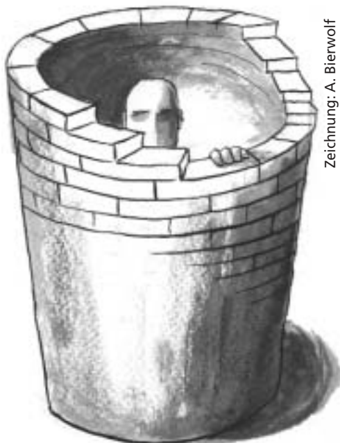
Zeichnung: A. Bierwolf

Leistungen nicht mehr für den Preis wie bisher anbieten und müsste diesen zwangsläufig erhöhen. Eine weitere Verschlechterung der Auftragslage wäre die Folge.